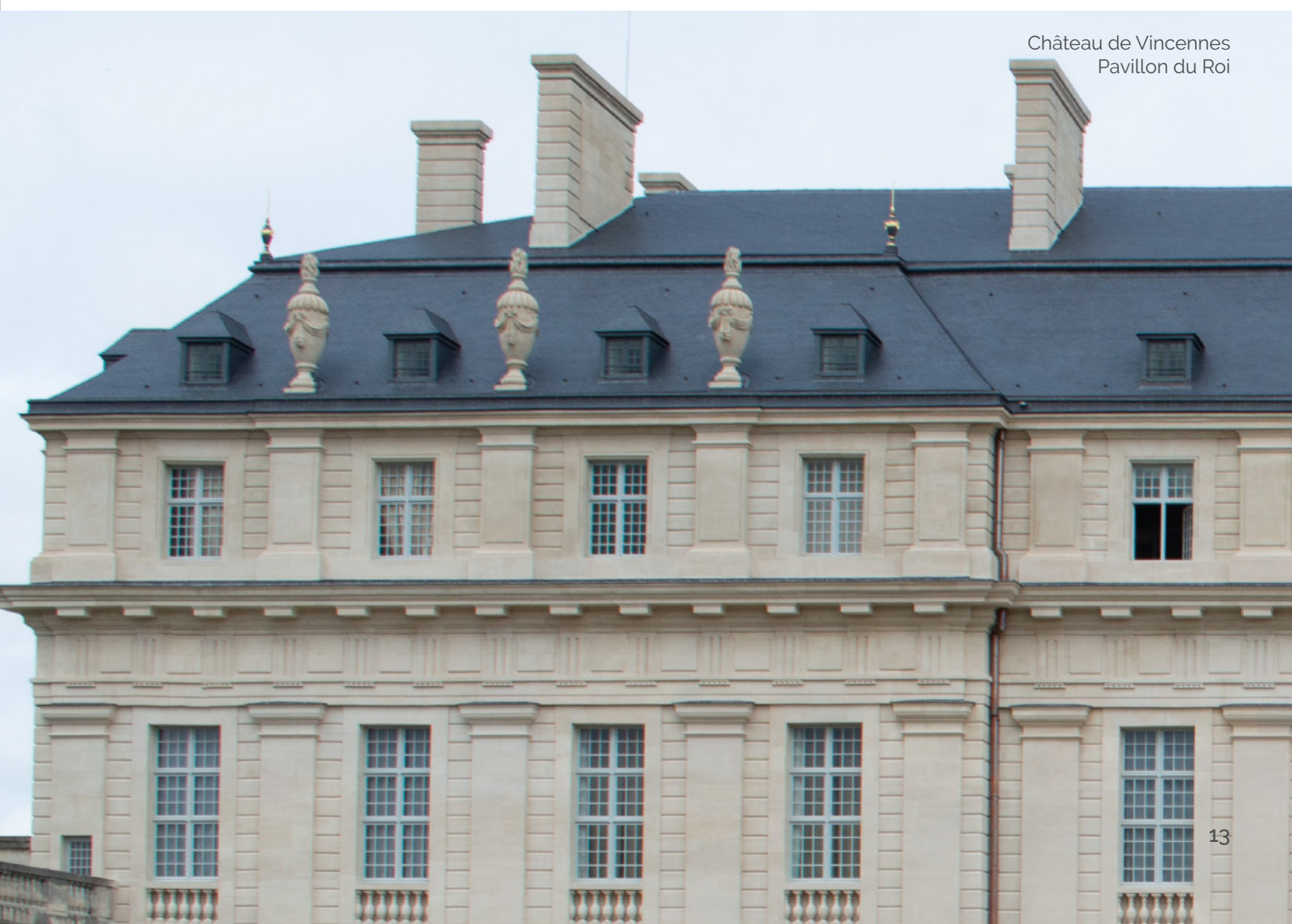
Château de Vincennes Pavillon du Roi