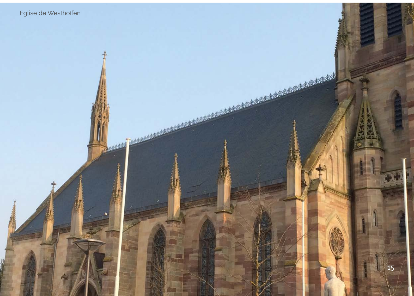
Eglise de Westhoffen